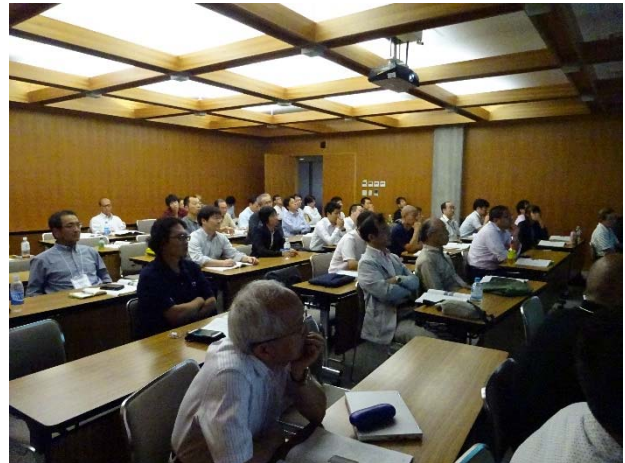
写真1 発表会場の様子

雪崩防災委員会では、(公社)日本雪氷学会雪崩分科会との共催で、標記セッション(以下、SP17と示す)を開催した。SP17では、趣旨説明の後、はじめに低気圧接近通過時における降雪現象、積雪として堆積した後の降雪結晶の振る舞いと雪崩現象との関係などについて、研究で取り組まれている内容および実務の現場で観察されている現状を口頭発表で4件報告頂いた。つぎに、本テーマで現在把握できている内容、今後明らかにすべき課題、ならびに研究者と実務者が連携できる事項について、参加者と討論した。