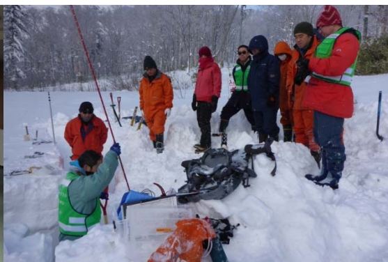
写真2 積雪観測実習