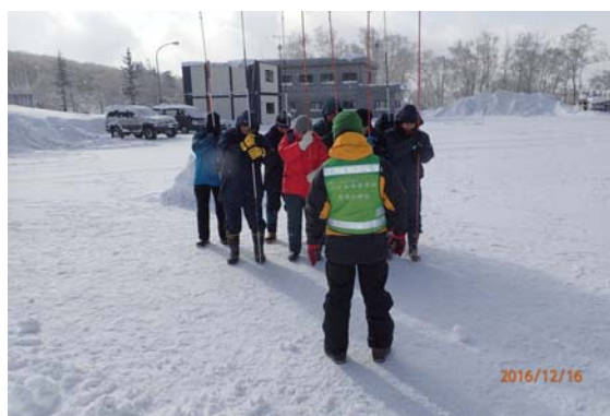
写真3 雪崩調査時の安全管理実習（プローブを用いた列索）