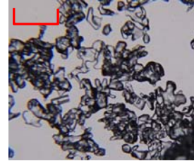
こしもざらめ雪/こしまり雪