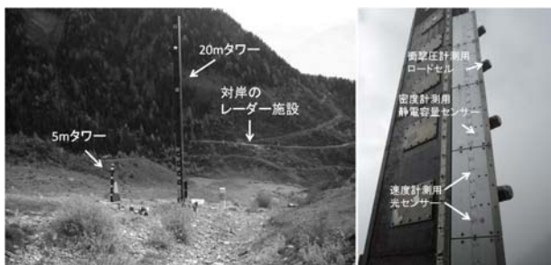
図1 スイスのシオン溪谷に設置された観測機器

一方、日本国内に目を転じると、道路雪崩災害データベース(北海道道路管理技術センター)の雪崩記録等にあるように、国内で災害をもたらした雪崩の規模は 10^1\sim 10^3\text{m}^3 程度に集中しており、各国で人工爆破により調査が進められている大規模な雪崩( 10^4\sim 10^5\text{m}^3 )に比べてはるかに小さい。そこでこの小さい規模の雪崩に焦点を絞って、2015年度より4年間にわたり国内でのフルスケールの人工雪崩実験(平成なだれ大実験)が北海道のニセコで実施されている。スケールが小さくなることで、これまでより接近した位置での観測や新たな観測手法の導入により、今まで見えなかった雪崩の素顔がより明らかになることが期待される。