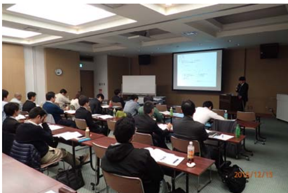
写真1 初日の講義の様子

管理技師会連合会継続学習制度(CPDS)プログラム 10.0unit の認定を受け、希望する受講者に受講証明書を発行しました。CPD の認定希望者が 12 名、CPDS の認定希望者が 3 名となり、当研修会への技術者の参加に対する効果が認められました。