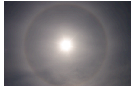
日暈（ひがさ）

どうしてそんなふうに見えるのだろう。そう思いながら空の不思議を写真に写します。例えば，いつもの見慣れた空に虹があったらちょっとびっくりするけれど，見つけた時は嬉しいですね。その時見つけた嬉しい気持ちと一緒に，空の写真を撮ります。そうしてできるのが空日記です。その時に思ったこと，不思議に感じたことも一緒に書いておくと，とても楽しい観察日記になります。空日記をつける時は写真でも，スケッチでもよいでしょう。今日はどんな空に出会いましたか。