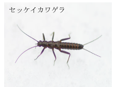
セッケイカワゲラ