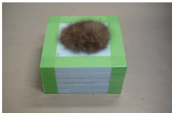
写真 7 透湿試験装置

ウン) でビーカーを覆った (写真 7, 8). -15^{\circ}\text{C} の低温室に 3 時間程度放置し, 水の温度変化, 水の蒸発量, 試験体の吸水量を測定した.