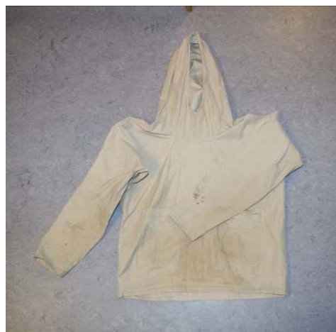
写真4 アンノガー (アノラック)

ポリエステル製の布などで作られた、前の開かないフード付きの衣類(写真4)。現在、登山用の衣類の名称として使われる「アノラック」の語源は、このグリーンランド語である。アンノガーに中綿を詰めて保温性を高めたものはアンノガーッハー (annoraarraaq) と呼ばれる。