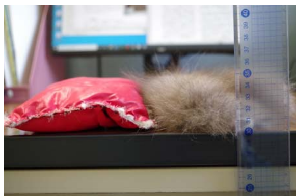
写真 8 試験体のダウンとキツネの毛皮 厚さはどちらも 50 mm 程度