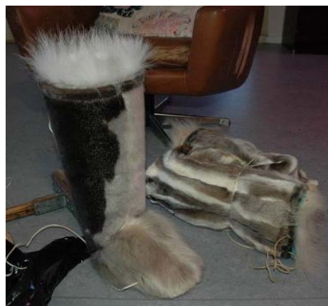
写真2 ニオガヤ (左) とカミッパ (右)

ワモンアザラシの皮を屋外で凍結乾燥させて、白くしたものを使用した靴。ワモンアザラシの皮は、洗浄および屋外で凍結乾燥させることにより、日光 (紫外線) による脱色作用で真っ白になる。この白い皮により作られた靴は、結婚式などの女性の正装に用いられる。日常的に使用されることもあるが、凍結乾燥により皮に微小な穴が開いており、防水性に劣るため狩猟などの用途には適さないとされている。