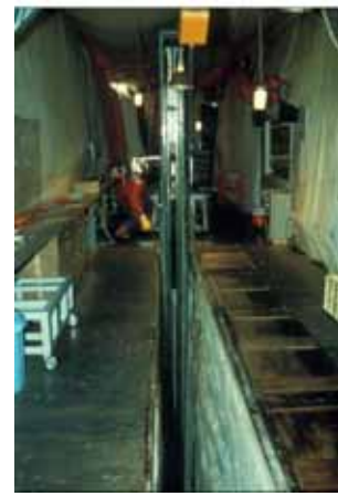
南極ドームふじでの 深層掘削（1996年）