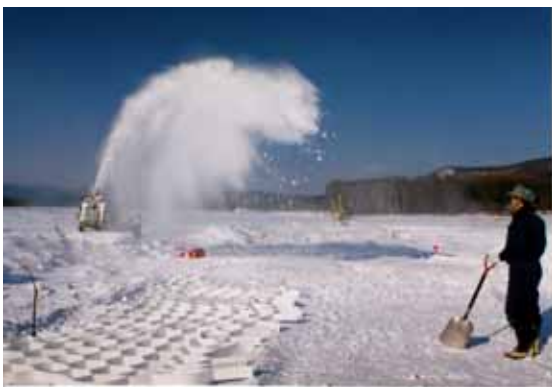
陸別での雪上滑走路実験（2005年）

南極ドーム基地で3035.2mまで掘削された深層氷床コアの解析の結果、この氷床コアには過去72万年間の地球の歴史が保存されていることが明らかになった。ここでは、明らかになった地球の歴史の変動の特徴とともに、この変動に超新星爆発や隕石落下などが関わってきたことなどを紹介する。