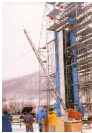
陸別での掘削機 開発実験（1992年）