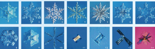
様々な形の雪の結晶 (1～13古川義純/大雪山・14. 山下 晃/カナダ北極圏)